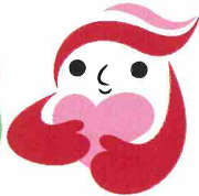
犯罪被害者等支援シンボルマーク「ギョっとちゃん」